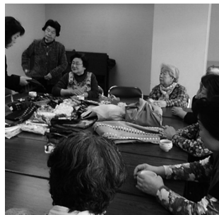
手作りサロンの様子

平成7年から経営しています。収益の一部を活動資金に充てています。どうぞご利用ください。