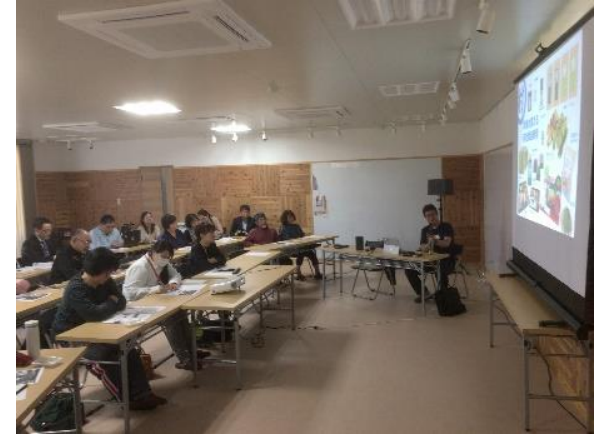
株式会社キャッセン大船渡とのコラボ企画、「南山城から学ぶ『地域ブランドの本質』」講演会の様子