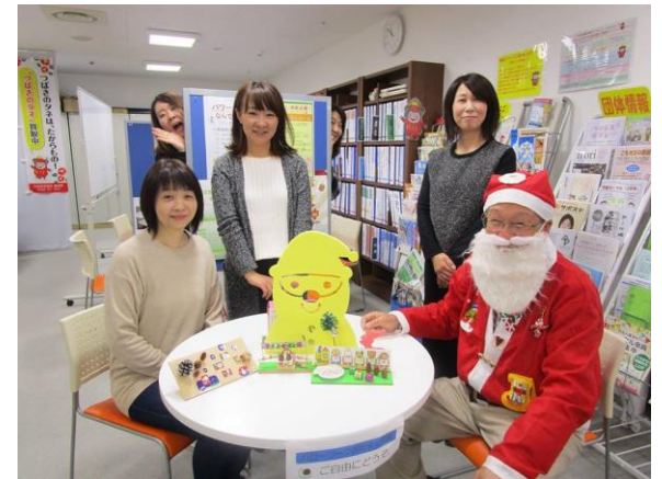
大船渡へ応援に来てくれた サンタさんとの記念写真