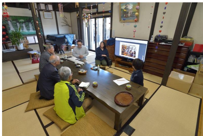
運営サポート：居場所創造プロジェクト (協力 いわて連携復興センター)