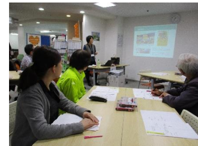
講座の様子：NPO法人 陸前高田まちづくり協働センター