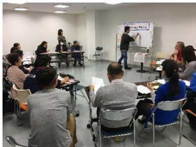
講座の様子：NPO法人 With You Global