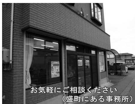
お気軽にご相談ください (盛町にある事務所)

地域の皆さんがお互いに見守り合い、異変の際にはすぐに相談につながる、共に支え合う地域づくりを目指します。