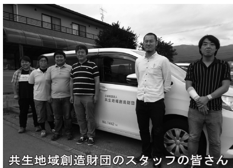
共生地域創造財団のスタッフの皆さん

ホームレス支援の全国組織と2つの生活協同組合が母体となつて、震災3日後から活動を開始。岩手沿岸の支援活動の拠点として、盛町に事務所を設置しています。復興に