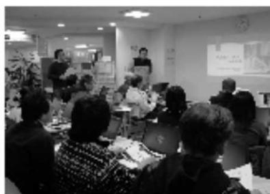
みんなで一緒に学ぼう会の様子

センターでは、活動を行う上で不可欠な事業の企画運営、資金調達、広報の仕方などについて学ぶ「みんなで一緒に学ぼう会」を毎月開催しています。