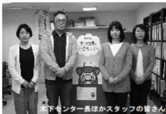
本下センター長ほかスタッフの皆さん