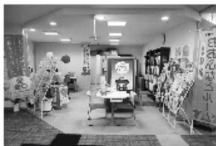
市民活動支援センターの様子

センターは、これらの団体の情報・交流に係る基盤とネットワークを構築し、さらなる活動の促進と協働の推進に資する中間支援団体として、重要な役割を担っています。